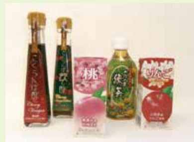
“本物”を追求した味を ぜひご堪能ください。