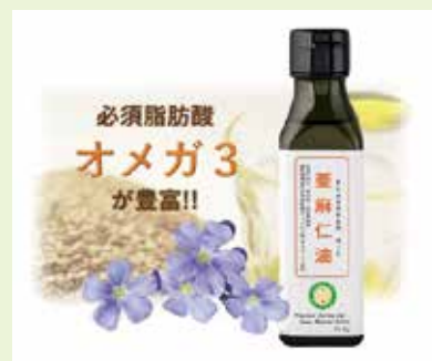
毎日摂りたい亜麻仁油