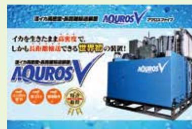
「AQUROS V (アクロスファイブ)」