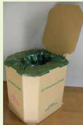
組み立てた状態の「エコ コスモトイレット」