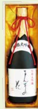
「別格大吟醸 まんさくの花」