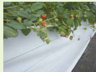
「白ピカ」を利用した防草シート のイチゴ栽培での使用例