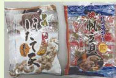
国産原料にこだわり安全、おいしさを追求!