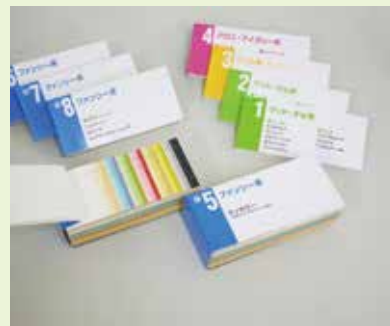
パピルプラス総合見本帳をご用意しています。