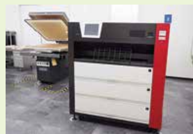
世界初の静電式電子写真方式 転写捺染システム