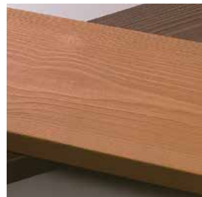
人工木材「彩木」の質感