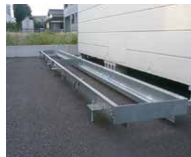
「かんたんグレーチング」