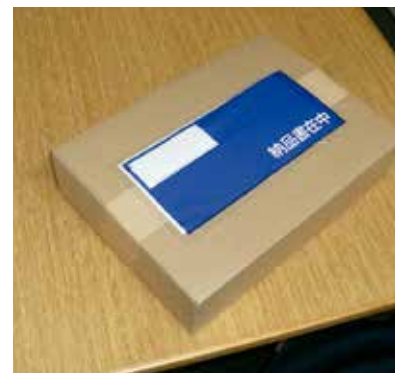
貼って便利! 「デリバリーパック」!!