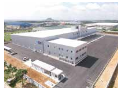
ベトナム最大級の冷蔵冷凍倉庫を ホーチミンの近隣で稼働開始しました。