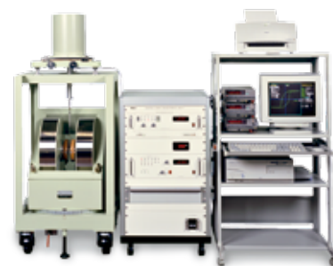
全自動高感度型振動試料型磁力計