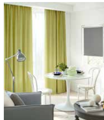
当社のコーディネート例