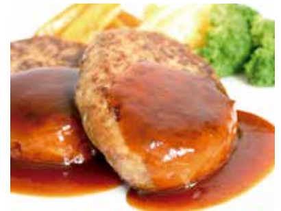
「100%十勝あおぞら牛 ハンバーグ」 (調理例)