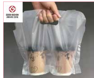
カップ飲料の持ち運びを便利にした「キャリーカップ」は2016年度グッドデザイン特別賞・BEST100に選ばれました。