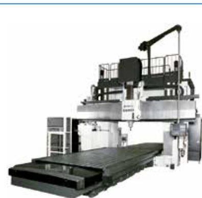
世界最高峰の門形マシンングセンタ