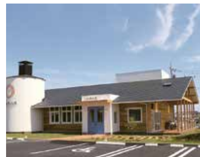
当社が開業をお手伝いした 「ベーカリーズキッチンオハナ」様 (埼玉県本庄市)