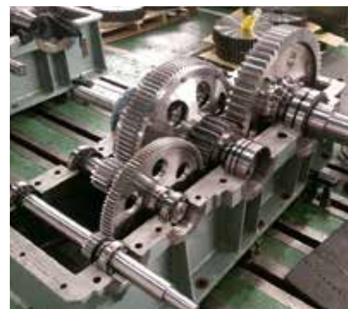
メーカーが対応しない歯車減速機のオーバーホールも手掛けます。