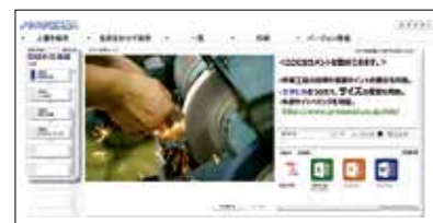
『ノウハウ伝承職人』の マニュアル作成画面