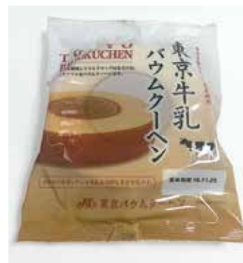
「東京牛乳バウムクーヘン」