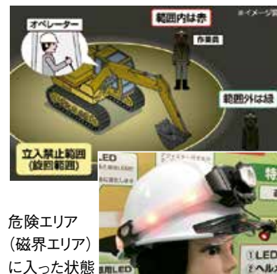
危険エリア (磁界エリア) に入った状態