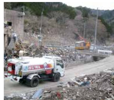
東日本大震災復興支援活動の様子