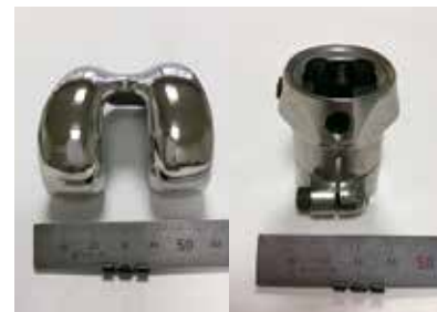
膝関節用大腿骨側コンポーネント（コバルト合金ASTM F75=左）と義足用足首パーツ（チタン合金[6-4合金]=右）