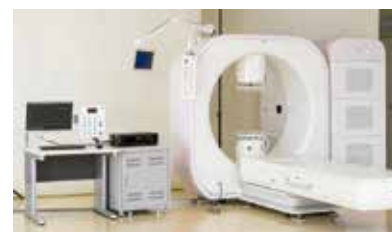
がんの治療機「アスクーフ8」