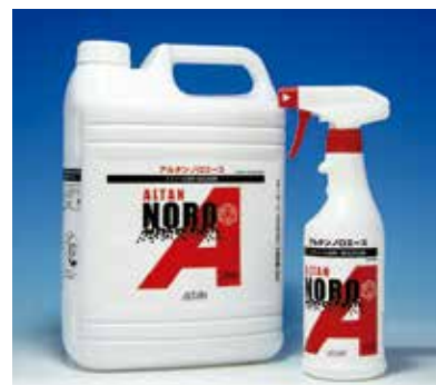
ウイルス対策柿渋含有除菌剤「アルタンノロエース」