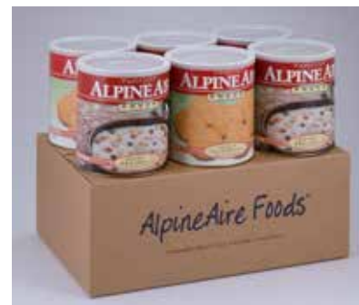
チキンシチュー・クラッカーセット 60食入