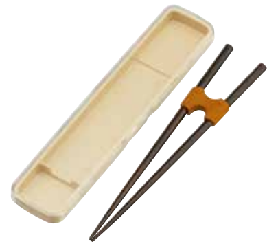
弱い力でも使いやすく工夫したサポート箸