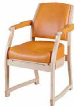
「スポーツとチェア」