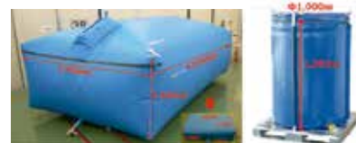
ソフトタンク12tタイプおよびその収納時(左)1tタイプ(右)