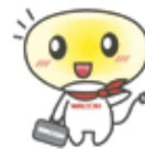
さまざまな場面で活躍する。左はマスコットキャラクター「ばーらん」