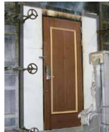
特定防火設備認定遮炎性能試験