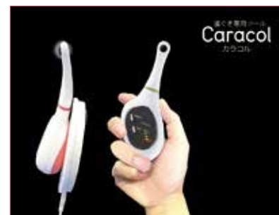
歯ぐき専用ツール「カラコル®」