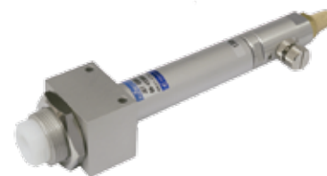
冷空気発生装置VTシリーズ