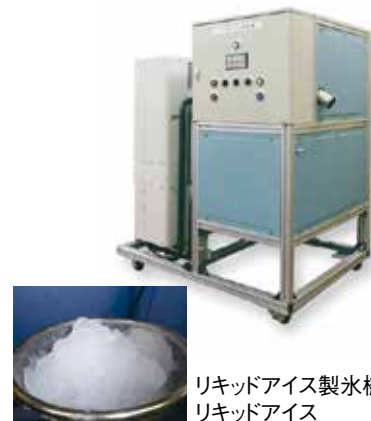
リキッドアイス製氷機と リキッドアイス