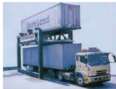
「コンテナ立体格納装置」