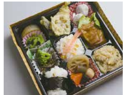
江戸・東京の伝統的な味を一折に詰め合わせた「江戸東京物語」は人気No.1