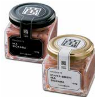
函館いか塩辛(黒)と 函館一夜干しいか塩辛(白)