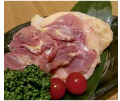
当社自慢のオリジナルブランド 「讃岐姫っ子どり」