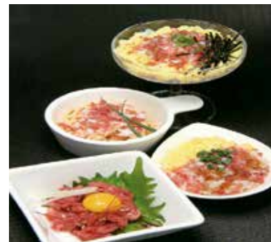
生食感の牛トロ井や牛ユッケ