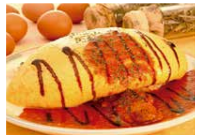
ハーブ卵「煌めき」で作ったオムライス。割るとトロトロ卵になります。