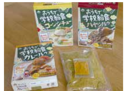
「おうちで学校給食シリーズ」。合成添加物無添加&動物性油脂不使用。小麦粉を使わず県産米粉で作っています。※「コーンシチュー」は原材料に乳を含みます。