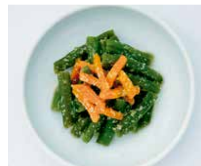
「エンヘルシリーズ」の人気商品 「いんげんの胡麻和え」