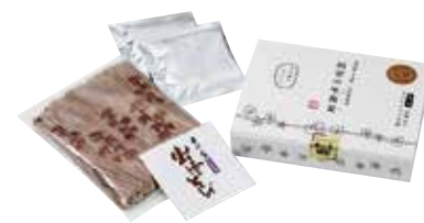
出雲そばは外皮まで挽きこんだ田舎そば。かみごたえと風味の強さが特徴です。「そば庄たまき 出雲の生そば」はネットショップからもお求めいただけます。