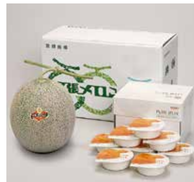
「夕張メロンピュアゼリー」も好評