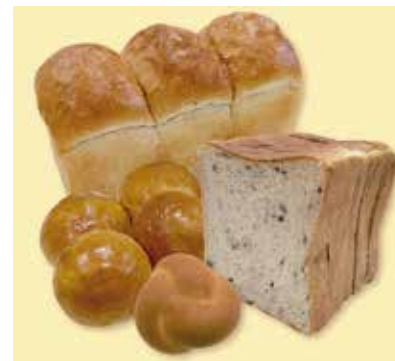
大麦食パン、乳酸菌バターボール、五穀健康食パン、豆乳クローバー