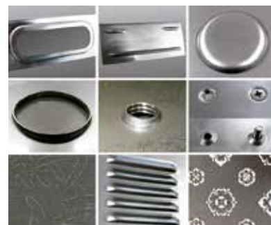
ファイバーレーザー複合機による加工例