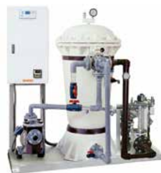
FRPタンク使用ろ過装置「SPFシリーズ」