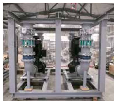
これまでに作製した プレファブ加工管の一例