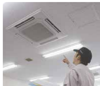
お客様に最適な空調環境を 提供いたします。