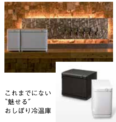
これまでにない “魅せる” おしぼり冷温庫