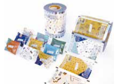
お菓子、お茶等へ長期保存を実現 する機能性フィルムをご提案