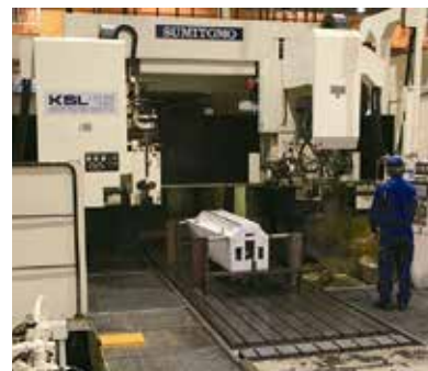
4000mmクラスの部品加工を可能にする大型ベッド研削盤