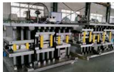
トランスファー金型も対応可能です