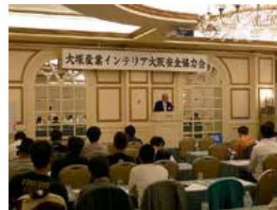
職方様との品質安全向上会議の様子