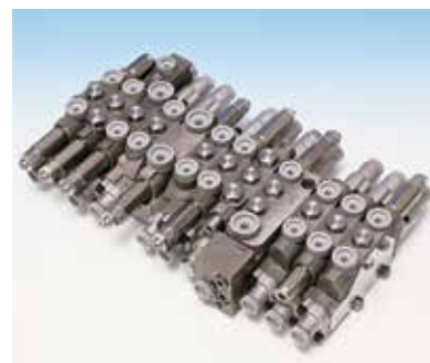
油圧シヨベル用 「油圧コントロールバルブ」