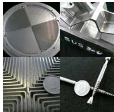
当社加工品の一例